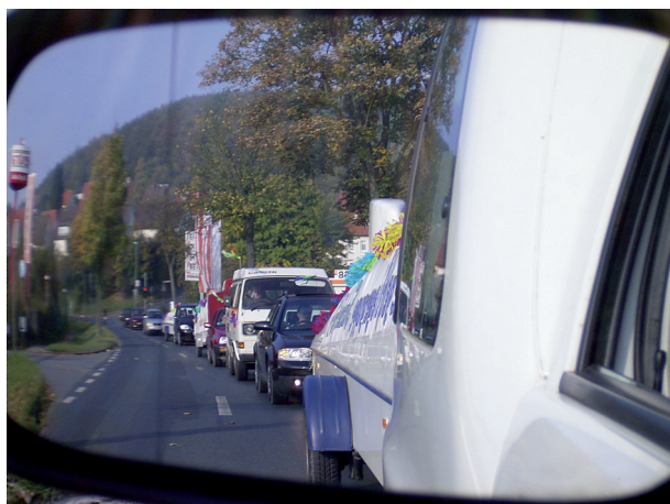
Segelflieger fahren im Konvoi durch Salzdettfurth.

dritten Liga fliegt. Wichtig ist, dass man regelmäßig (am besten natürlich jedes Wochenende!) berichtet. Ziele wie Aufstieg in die zweite Liga oder Vermeidung des Abstiegs müssen der Öffentlichkeit kommuniziert werden und der örtlichen Presse muss man Tabellen liefern, in der man die Platzierung des Heimatvereins sieht. Eine perfekte Öffentlichkeitswirkung erzielte die SFG Salzdettfurth: als sie am Ende der Saison 2005 den Aufstieg in die Bundesliga schaffte, wurde ein Umzug durch die Stadt organisiert (Bild unten), an dem die Bevölkerung begeistert teilnahm.